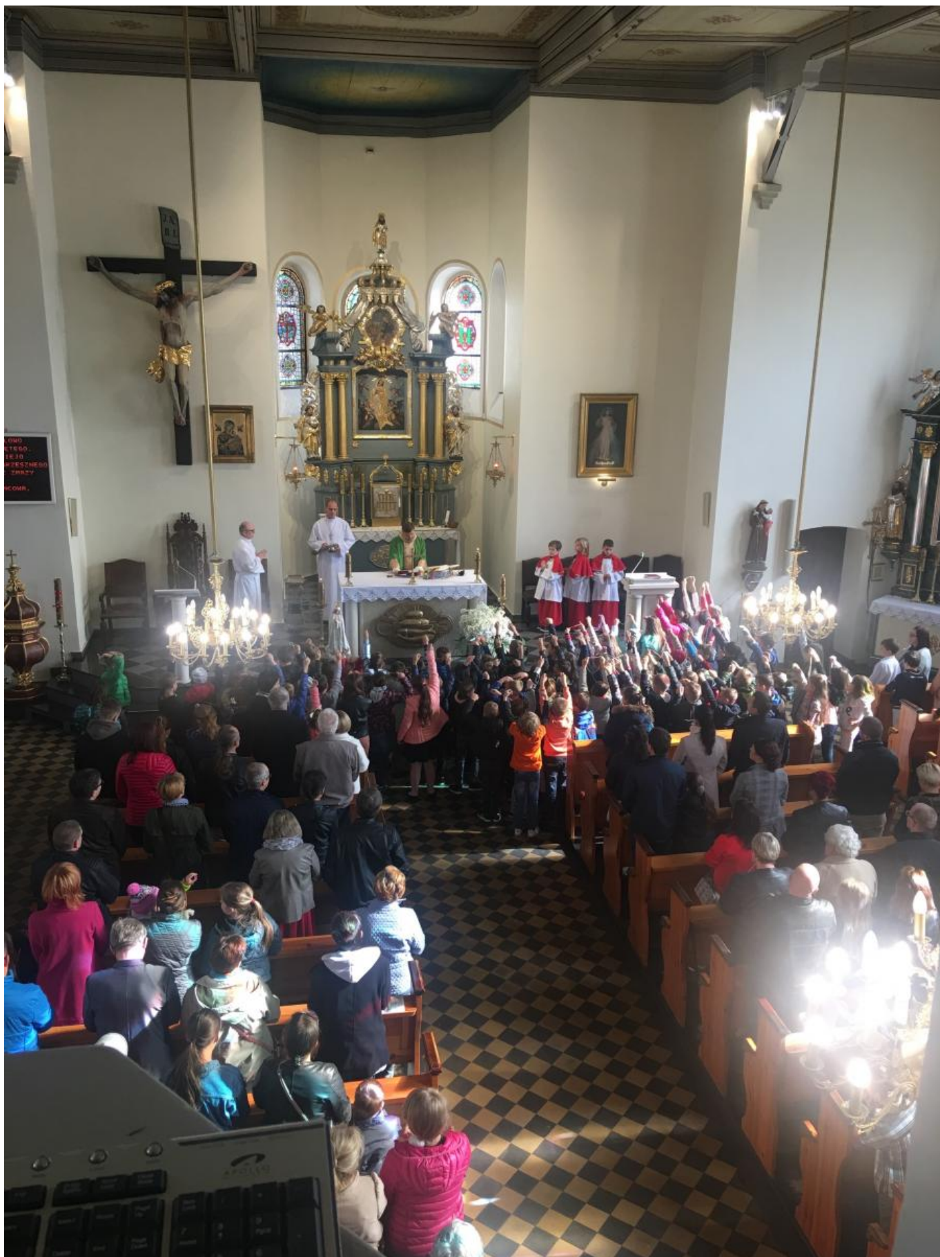
PIELGRZYMKA OSIELSKO - BYSZEWO / 7.09.2019